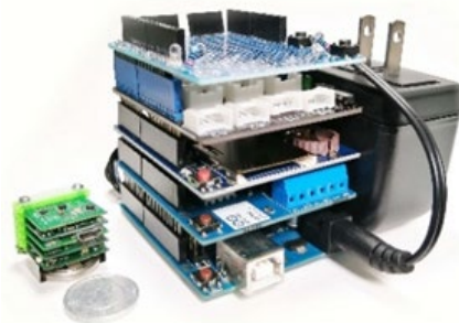
Arduinoとの比較 小型化を実現したLeafony