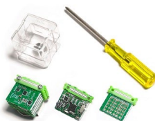
Basic Kit 2