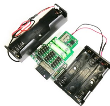
ESP Wi-Fi Kit 2